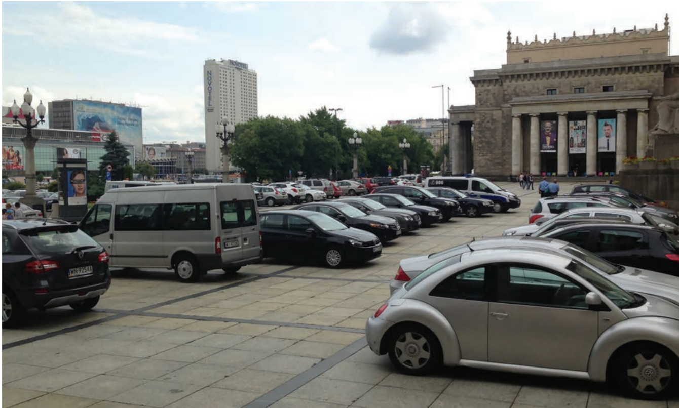
Plac Defilad, 2013, fot. archiwum Baru Studio